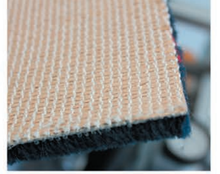
Şeffaf tabanı kendi halı tabanınızla kullanınız.