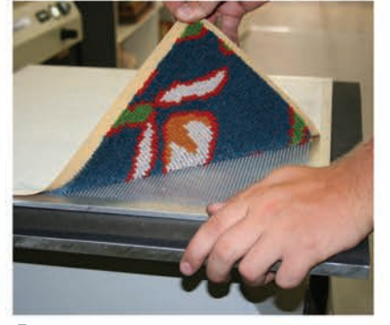
Dakikalar sonar numune hazır!