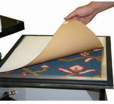
Numuneye hotmelt uygulayın