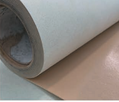
Astarlı hotmelt taban (poly'li)